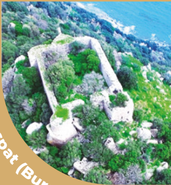
Burg Aspat (Burg Cifit)

Die Burg, die während der Herrschaft von König Mausolos erbaut wurde, wurde als Wachturm errichtet. Es liegt auf einem Hügel mit Blick auf die Bucht von Aspat.