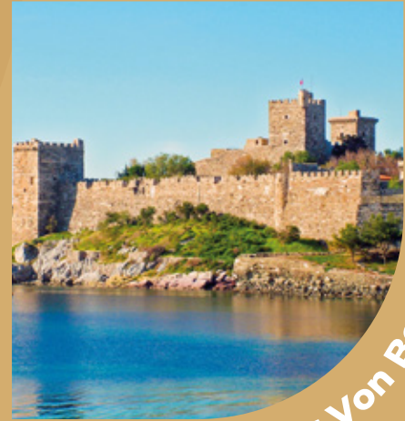
Burg Von Bodrum

*Die Entfernung zum Hotel beträgt 10,2 km.