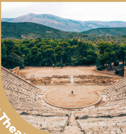
Antikes Theater Bodrum

Es ist die einzige Struktur, die in der klassischen Zeit von Bodrum erhalten geblieben ist. Dieses Theater am südlichen Rand des Berges Göktepe mitten in Bodrum ist eines der ältesten Theater in Anatolien. Dieses Theater, das in den 1960er Jahren von einer Gruppe Türken restauriert wurde (die letzte Restaurierung in Zusammenarbeit mit der Staatverwaltung Bodrum, Ericsson und Turkcell), veranstaltet noch heute viele Festivals in Bodrum.