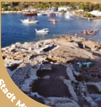
Antike Stadt Myndos

Sie wurde von den Lelegern gegründet, während der Mausolos-Zeit nach Norden verlegt und wieder aufgebaut. Leider wurde die Stadt von Erdbeben überschwemmt, und heute ist es möglich, die Überreste dieser Stadt auf der Straße von der Küste von Gümüşlük zur Insel Tavşan zu Fuß vom Meer aus zu sehen.