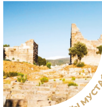
КИЗИЛХИСАРЛЫ МУСТАФА ПАША МЕЧЕТЬ