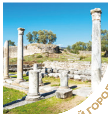
ДРЕВНИЙ ГОРОД ПЕДЕЗА