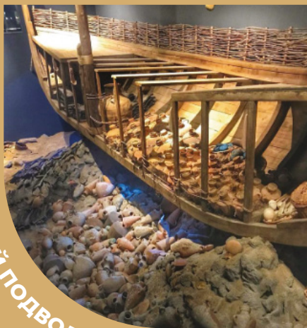
БОДРУМСКИЙ МУЗЕЙ ПОДВОДНОЙ АРХЕОЛОГИИ

М.О 14 г. до н.э. М.С 16г.д.э Из-за его богатой подводной коллекции, относящейся к названию музея было переименовано в Музей подводной археологии Бодрума в 1981 году. Это единственный музей нашей страны и самый важный музей подводной археологии в мире. Бодрумский музей подводной археологии удостоен специальной европейской награды 1995 года.