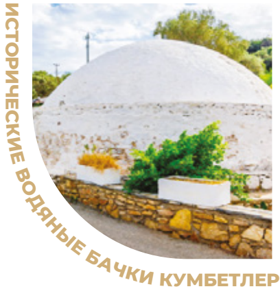
ИСТОРИЧЕСКИЕ ВОДЯНЫЕ БАЧКИ КУМБЕТЛЕР

Эти исторические цистерны, расположенные по всему полуострову, были построены сотни лет назад для сбора дождевой воды. Считается, что некоторые из них были построены в византийский период, а другие — во времена правления Сулеймана Великолепного.