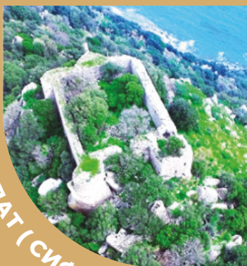
ЗАМОК АСПАТ ( СИФИТ ЗАМОК )

Замок, построенный во времена правления короля Мавзола, был построен как сторожевая башня. Он расположен на холме с видом на залив Аспат.