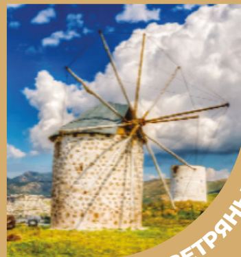
БАРДАКЧИ ВЕТРЯНЫЕ МЕЛЬНИЦЫ