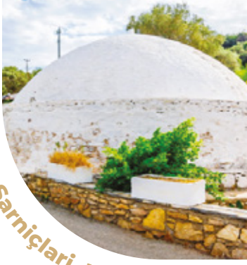
Tarihi Su Sarniçları Kümbetler

Yarımadanın dört bir yanında bulunan bu tarihi sarniçlar yüzlerce yıl önce yağmur suyunu toplamak için inşa edilmişler. Kiminin Bizans döneminde, kimininse Kanuni Sultan Süleyman döneminde inşa edildiği düşünülmektedir.