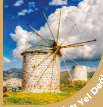
Bardakçı Yel Değirmenleri