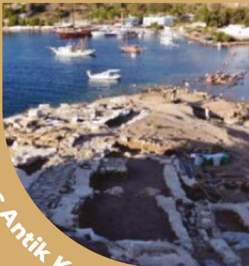
Myndos Antik Kenti

Lelegler tarafından kurulmuş. Mausolos dönemindeyse biraz kuzeye taşınıp yeniden inşa edilmiş. Kent ne yazık ki depremlerle sulara gömülmüş, bugün Gümüşlük sahilinden Tavşan Adası'na denizden yürüyerek gidilen yolda bu kentten kalan kalıntıları görebilmek mümkün.