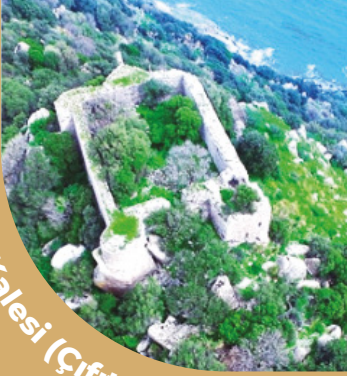
Aspat Kalesi (Çıft Kalesi)

Kral Mausolos döneminde inşa edilmiş olan kale bir gözetleme kalesi olarak inşa edilmiştir. Aspat koyuna hakim bir tepede yer almaktadır.