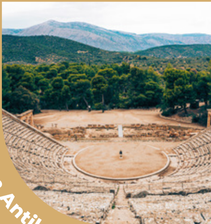
Bodrum Antik Tiyatro

Klasik çağdaki Bodrum'dan günümüze ulaşabilen tek yapıdır. Bodrum'un ortasındaki Göktepe dağının güney eteklerindeki bu tiyatro, Anadolu'nun en eski tiyatrolarından biridir. 1960'larda bir grup Türk tarafından restore edilen bu tiyatro, (En son restorasyonu Bodrum Belediyesi, Ericsson ve Turkcell işbirliği ile) günümüzde de Bodrum'daki birçok festivale sahne olmaktadır.