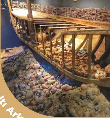
Bodrum Sualtı Arkeoloji Müzesi

M.Ö.14. yüzyıldan M.S.16. yüzyıla uzanan zengin sualtı koleksiyonu nedeniyle Müzenin ismi 1981 yılında Bodrum Sualtı Arkeoloji Müzesi olarak yeniden belirlenmiştir. Ülkemizin tek, dünyanın en önemli sualtı arkeoloji müzesidir. Bodrum Sualtı Arkeoloji Müzesi, 1995 Yılı Avrupa Özel Övgü Ödülü'ne sahiptir.