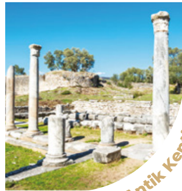
Pedesa Antik Kenti